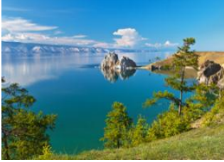
Irkoutsk 📍 🚗 300km - ⌚ 5h Ile Olkhon 📍