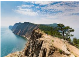
Ile Olkhon 📍