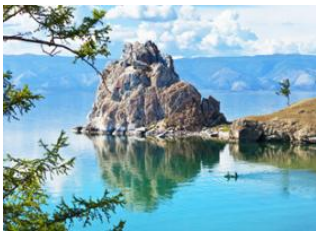
Ile Olkhon 📍