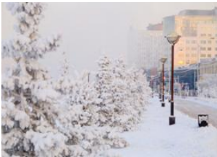
Ile Olkhon 📍 🚗 - ⌚ 5h Irkoutsk 📍