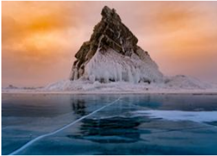
Ile Olkhon 📍